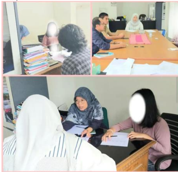
Gambar 1. Pelaksanaan pendampingan asertif korban kekerasan seksual

interaksi sosial dan juga merasa takut untuk bersentuhan kepada lawan jenis oleh sebab itulah penulis melakukan kegiatan untuk meningkatkan asertif para korban yang mengalami pelecehan seksual kegiatan pendampingan yang diberikan pada korban yang mengalami pelecehan berupa pertama, penulis memberikan sesi lecturing dengan menjelaskan pemahaman mengenai perilaku asertif, manfaat dari perilaku asertif serta faktor yang mempengaruhi perilaku asertif, pada tahap kedua penulis memberikan sesi lecturing mengenai proses individu untuk menjadi lebih asertif. Terdapat 3 cara agar individu menjadi asertif. Pertama, individu harus mempunyai tujuan dalam berkomunikasi. Kedua, individu harus perhatikan bahasa tubuh dan ketiga, individu harus memulai percakapan yang asertif tapi tetap memperhatikan lawan bicaranya atau orang yang sedang diajak untuk komunikasi, pada tahap ketiga Setelah memberikan lecturing , Diakhir sesi ini penulis memberikan edukasi tentang bentuk bentuk pelecehan seksual dan cara agar dapat menghindari pelecehan seksual,serta megedukasi korban untuk tidak takut untuk melakukan interaksisosial pada lawan jenis maupun sesama jenis.