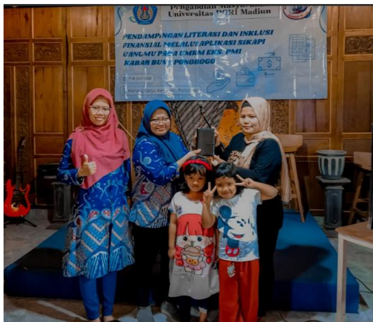
Gambar 5. Penyerahan Dompot Budgeting