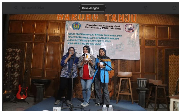
Gambar 6. Pembagian Hadiah