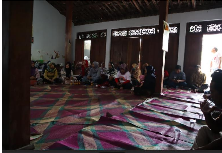
Gambar 7. Kegiatan Pengisian Dompet Budgeting

Pada hari kedua peserta datang untuk belajar mengisi dompet budgeting . Transaksi yang dilakukan selama satu bulan berjalan diisikan pada dompet budgeting . Kegiatan ini dilaksanakan di sekretariat Kabar Bumi yang beralamat di Desa Ronosentan siman Ponorogo.