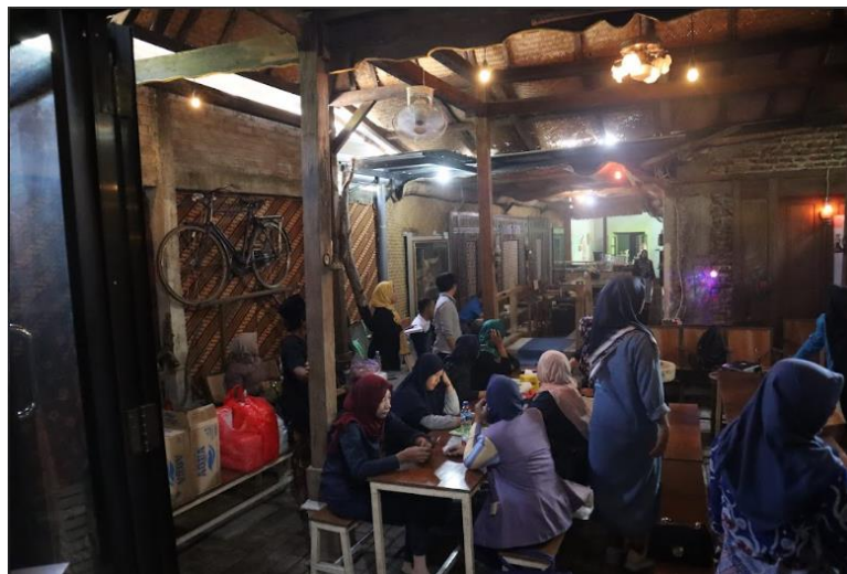
Gambar 3. Persiapan Pelaksanaan Kegiatan Pengabdian Kepada Masyarakat

Pada hari pertama kegiatan pelatihan diakhiri dengan pembagian dompet budgeting . Dompet ini sebagai materi tambahan untuk mengetahui kemampuan peserta dalam mengelola keuangan UMKM. Peserta kegiatan diberikan pekerjaan rumah untuk mengisikan catatan keuangan mereka pada dompet budgeting yang selanjutnya akan dibahas pada hari berikutnya.