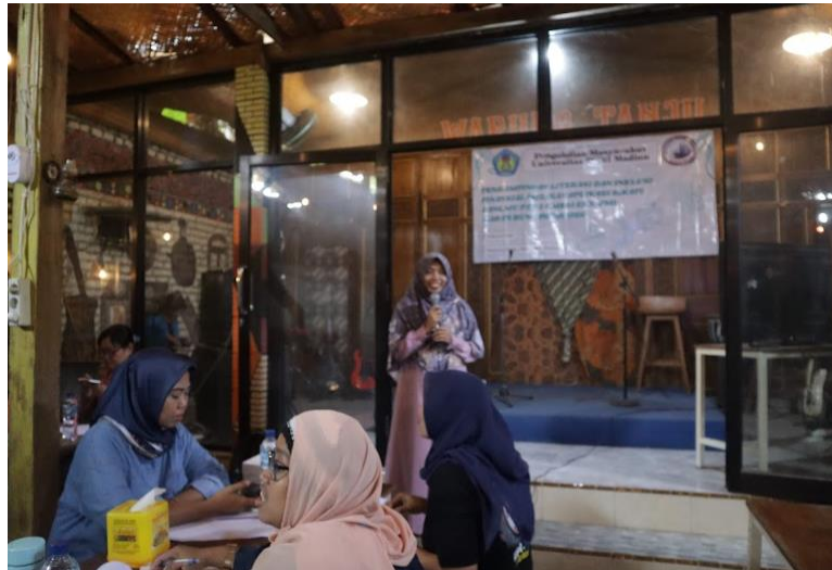
Gambar 4. Pemaparan materi inklusi oleh pemateri