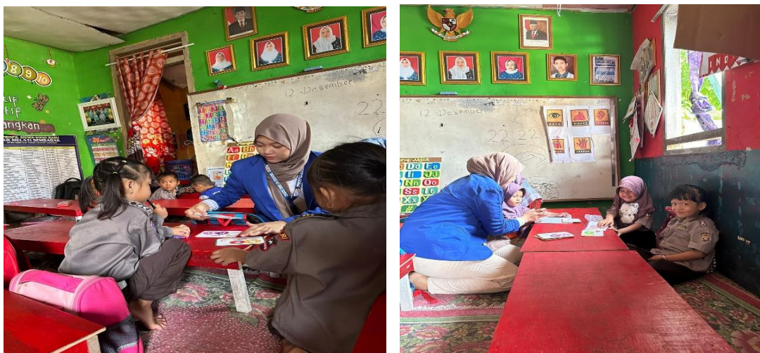
Gambar 2. Contoh Gambar

Pada tanggal 29 november 2023 untuk terakhir kalinya penulis mengajar di paud Sejahtera, disini penulis memberikan Kembali media flashcard buah dan hewan kepada anak, setelah memberikan 2 media flashcard tersebut kepada masing-masing anak, lalu penulis memberikan instruksi kepada anak untuk mewarnai terlebih dahulu media flashcard tersebut dan menuliskan hewan dan buah apa yang ada di media flashcard tersebut, setelah diwarnai penulis mengambil seluruh media flashcard tersebut lalu penulis menunjuk satu – satu anak untuk maju kedepan lalu penulis memberikan media flashcard kepada anak secara acak untuk menebak hewan dan buah apa yang ada pada gambar di media flashcard tersebut, terlihat anak mampu menebak hewan dan buah yang telah penulis berikan, dari beberapa rangkaian kegiatan yang telah penulis berikan kepada anak-anak usia dini di paud Sejahtera terlihat adanya perkembangan yang signifikan pada anak-anak di paud Sejahtera yang awalnya hanya menguasai 12 kosa kata hewan dan buah, kini anak-anak mampu menyebutkan lebih dari 12 kosa kata dan mengetahui jenis-jenis hewan dan buah dengan hanya menunjukkan gambar saja.