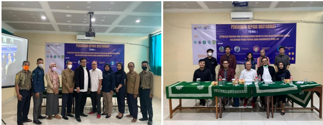
Gambar 4. Seminar Tentang Ketenagakerjaan Pada Saat Seminar Hasil PKM

Pada Kegiatan ketiga ini membahas mengenai peningkatan pemahaman tentang ketenagakerjaan kepada mitra dan membahas mengenai seluruh rangkaian kegiatan pkm dari awal dilakukan. Hasil Kegiatan : Dalam proses seminar, para peserta antusias pada materi yang di sampaikan. Pimpinan dan pegawai pcm kramat jati cukup aktif bertanya dan memperdalam pemahaman mereka atas materi tentang ketenagakerjaan.