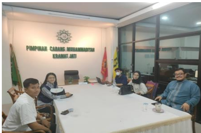
Gambar 2. Kegiatan Teknis TIM Perumus Perubahan Peraturan Pokok Pokok Kepegawaian

Sosialisasi kegiatan pertama kepada mitra ini termasuk rangkaian kegiatan PKM, juga pelatihan dan pendampingan kepada mitra. Untuk mengetahui pentingnya kelembagaan, maka kegiatan pelatihan akan diberikan. Selanjutnya mitra akan didampingi saat menyusun tim perubahan peraturan pokok-pokok kepegawaian agar menyerap masukan dan mampu merubah pasal-pasal terkait agar lebih optimal. Hasil Kegiatan: Pengetahuan peserta terkait dengan kelembagaan meningkat dan pengetahuan peserta tentang tugas pokok serta fungsi masing masing jabatan juga meningkat