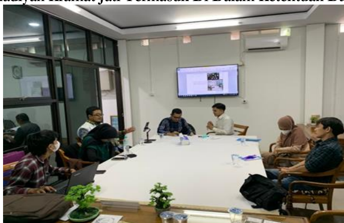
Gambar 3. Kegiatan Pendampingan Perubahan Peraturan Pokok Pokok Kepegawaian Pimpinan Cabang Muhammadiyah Kramat Jati

Kegiatan kedua ini terdiri atas paparan mengenai pentingnya Optimalisasi Peraturan Pokok Kepegawaian Nomor 090/KEP/IV.0/D/2015 Dalam Meningkatkan Jaminan Kesejahteraan Pegawai Pimpinan Cabang Muhammadiyah Kramat Jati, mitra akan didampingi terkait dengan perubahan pasal pasal terkait dana pensiun yang relevan untuk optimalisasi Perubahan Peraturan Pokok Pokok Kepegawai Pimpinan Cabang Muhammadiyah Kramat Jati. Hasil Kegiatan: Keterampilan peserta meningkat untuk menginventarisasi, menyusun, mencari sumber dan merumuskan pasal pasal mana saja yang dirubah dan mana yang dipertahankan pada Peraturan Pokok Kepegawaian Nomor 090/KEP/IV.0/D/2015 Dalam Meningkatkan Jaminan Kesejahteraan Pegawai Pimpinan Cabang Muhammadiyah Kramat Jati.