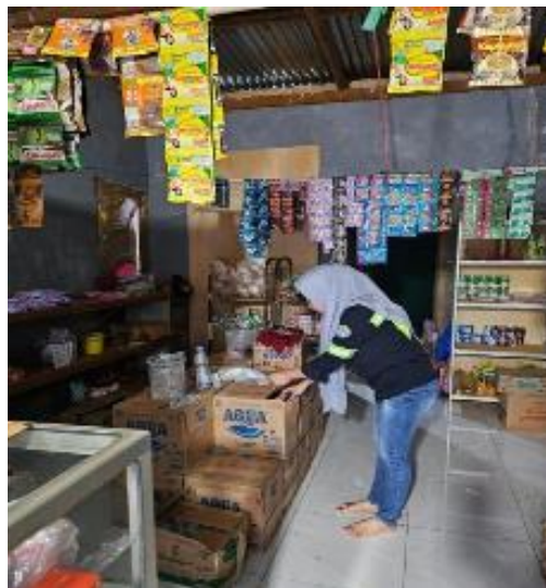
Gambar 3. Pendampingan Berwirausaha

Pengabdian kepada masyarakat ini membekali masyarakat agar dapat berwirausaha dengan keterampilan bisnis, pengetahuan, dan pola pikir kewirausahaan yang penting, sehingga memungkinkan mereka untuk mengidentifikasi dan memanfaatkan peluang, mengelola bisnis secara efektif, dan beradaptasi dengan perubahan kondisi pasar. Adapun kewirausahaan merupakan sikap mental dan sifat jiwa yang selalu aktif dalam berusaha untuk memajukan karya baktinya dalam rangka upaya meningkatkan pendapatan di dalam kegiatan usahanya. Selain itu, kewirausahaan adalah kemampuan kreatif dan inovatif yang dijadikan dasar, kiat, dan sumber daya untuk mencari peluang menuju sukses [13][14]. Program pendampingan bertujuan untuk memberikan pendidikan dan pengetahuan mengenai pengembangan usaha agar menjadi lebih baik lagi, serta melakukan berbagai pendekatan manajemen dan strategi pengembangan yang lebih baik. Berwirausaha melibatkan dua unsur pokok yakni; (a) peluang dan, (b) kemampuan menanggapi peluang. Berdasarkan hal tersebut, maka definisi kewirausahaan adalah tanggapan terhadap peluang usaha yang terungkap dalam seperangkat tindakan serta membuahkan hasil berupa organisasi usaha yang melembaga, produktif dan inovatif.