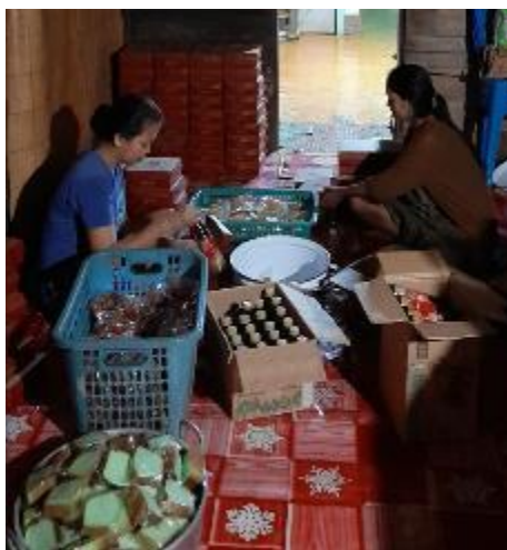
Gambar 4. Pemberdayaan Masyarakat Dalam Berwirausaha

Tujuan pemberdayaan masyarakat dalam kegiatan kengabdian kepada masyarakat terkait kewirausahaan ini agar dapat membuka lapangan pekerjaan, meningkatkan pendapatan serta mengurangi pengangguran.