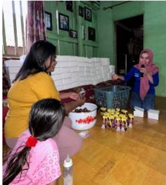
Gambar 2. Penyampaian Materi Kewirausahaan

Pengabdian kepada masyarakat ini membekali masyarakat agar dapat berwirausaha dengan keterampilan bisnis, pengetahuan, dan pola pikir kewirausahaan yang penting, sehingga memungkinkan mereka untuk mengidentifikasi dan memanfaatkan peluang, mengelola bisnis secara efektif, dan beradaptasi dengan perubahan kondisi pasar. Adapun kewirausahaan merupakan sikap mental dan sifat jiwa yang selalu aktif dalam berusaha untuk memajukan karya baktinya dalam rangka upaya meningkatkan pendapatan di dalam kegiatan usahanya. Selain itu, kewirausahaan adalah kemampuan kreatif dan inovatif yang dijadikan dasar, kiat, dan sumber daya untuk mencari peluang menuju sukses [13][14]. Program pendampingan bertujuan untuk memberikan pendidikan dan pengetahuan mengenai pengembangan usaha agar menjadi lebih baik lagi, serta melakukan berbagai pendekatan manajemen dan strategi pengembangan yang lebih baik. Berwirausaha melibatkan dua unsur pokok yakni; (a) peluang dan, (b) kemampuan menanggapi peluang. Berdasarkan hal tersebut, maka definisi kewirausahaan adalah tanggapan terhadap peluang usaha yang terungkap dalam seperangkat tindakan serta membuahkan hasil berupa organisasi usaha yang melembaga, produktif dan inovatif.