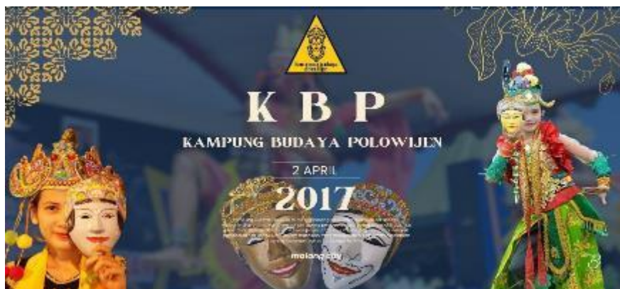
Gambar 4. Desain Stiker Setelah revitalisasi strategi

Peningkatan praktik promosi digital, terutama melalui media sosial seperti Instagram, menunjukkan adaptasi terhadap tren teknologi dan komunikasi. Ini memperluas jangkauan pemasaran dan membantu membangun citra positif kampung sebagai destinasi kuliner yang menarik.