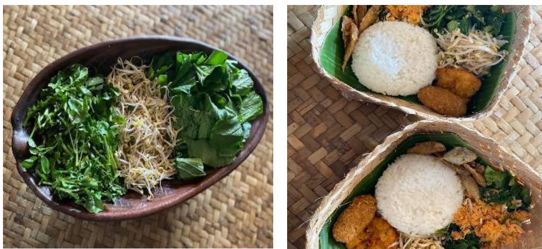
Gambar 3. Nasi Berkat Krawu Khas Kampung Budaya Polowijen

Melalui aktivitas pengabdian masyarakat ini, kami berharap tidak hanya menciptakan nasi berkat yang lezat dan berkualitas, tetapi juga meninggalkan dampak positif yang lebih luas. Kami menginginkan agar keberlanjutan, keterlibatan masyarakat, dan filosofi lokal terus menjadi fokus dalam pengembangan kuliner. Harapan kami adalah agar nasi berkat besek tidak hanya menjadi hidangan lokal yang populer tetapi juga menjadi simbol dari bagaimana masyarakat dapat merawat, menghargai, dan mengembangkan warisan kuliner mereka sendiri.