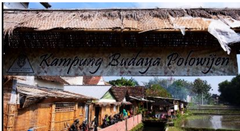
Gambar 1. Kampung Budaya Polowijen

Faktor-faktor yang Mendukung Perkembangan Kampung Budaya Polowijen: Keterlibatan aktif masyarakat: Masyarakat Kampung Budaya Polowijen sangat aktif dalam berbagai kegiatan, seperti pertunjukan tari topeng Malangan, pelatihan membatik, dan pembuatan souvenir. Terdapat potensi yang belum dioptimalkan di KBP yaitu terkait kuliner padahal mereka memiliki ciri khas yang memiliki nilai ekonomis. Warisan kuliner unik dari kampung Budaya Polowijen yang patut dilestarikan: Nasi Berkat Berwadah Besek. Hidangan tradisional ini sarat makna budaya dan nilai-nilai lokal, namun terkendala oleh minimnya promosi dan modernisasi.