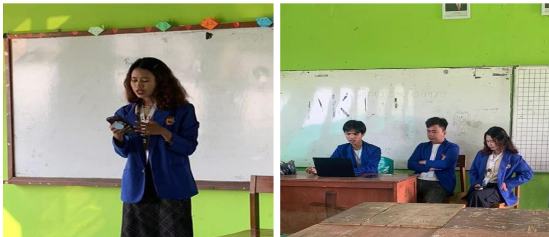
Gambar 2. Contoh Gambar

Pada minggu kedua, penulis melanjutkan kegiatan sosialisasi dengan fokus pada isu bullying . Sosialisasi dilakukan dalam bentuk diskusi kelompok dengan tujuan memberikan pemahaman mendalam kepada siswa mengenai dampak negatif bullying . Metode pembelajaran aktif, seperti diskusi kelompok, digunakan untuk memberikan siswa kesempatan untuk berpartisipasi aktif. Hasilnya, siswa terlibat dalam diskusi yang produktif, saling bertukar pendapat, dan lebih memahami isu sosial yang aktual, termasuk dampak negatif bullying . Kendala siswa yang kurang interaktif diatasi dengan kebijakan ice breaking dan pendekatan diskusi kelompok. Ice breaking menciptakan suasana yang lebih santai, sementara diskusi kelompok memberikan kesempatan kepada siswa untuk berpartisipasi aktif.