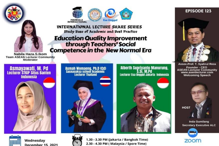
Gambar 2. Poster kegiatan International Lecture Share Series Episode 123.