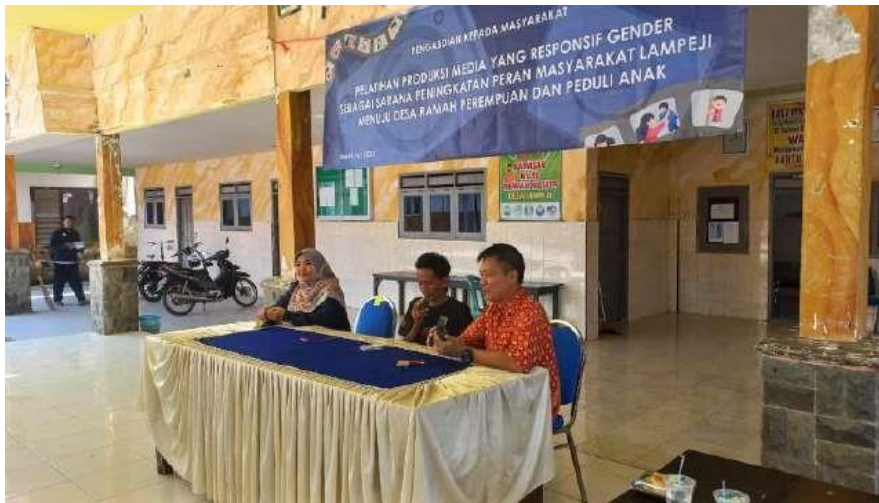
Gambar 6. Pendekatan Partisipatoris dan diskusi tentang proses pembuatan film

Pelatihan pembuatan media ini menjadi titik penting dimana peserta akan praktek secara langsung. Pemahaman atas alat bantu editing harus dipahami oleh semua orang. Begitupula terkait bagaimana penulisan naskah dan proses pengambilan gambar. Pemateri memberikan penjelasan dengan sederhana namun mudah dipahami oleh masyarakat desa Lampeji Kecamatan Mumbulsari Kabupaten Jember. Pelatihan ini dipimpin oleh tim pengabdian yang berkapasitas dalam bidang editing dan shooting video. Peserta tertarik dengan berbagai alat yang digunakan untuk mengambil gambar sehingga beberapa kali tim pengabdian mengajari para peserta bagaimana memfungsikan masing-masing alat tersebut.