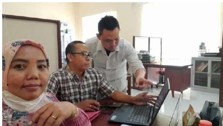
Gambar 2. Dokumentasi Perencanaan Awal

Tahap persiapan dimulai sejak bulan April 2023. Pada bulan April tim menyusun dan merencanakan semua agenda yang akan dilakukan dari awal hingga akhir masa pengabdian. Di tahap ini tim banyak melakukan diskusi dan interaksi dengan intensif satu sama lain sehingga tersusun dengan baik perencanaan pengabdian. Penentuan lokasi penelitian juga ditentukan di tahap ini sebelum benar-benar memutuskan untuk terjun ke lapangan. Tahapan ini tim berdiskusi menentukan tema pengabdian. Tema ini adalah background besar pengabdian sehingga tema yang diambil adalah edukasi stunting melalui media film yang melibatkan masyarakat secara langsung.