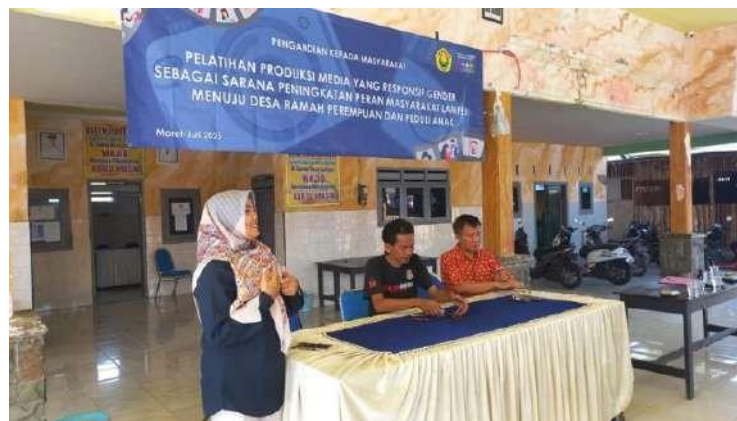
Gambar 8. Pendekatan Partisipatoris dan diskusi tentang proses FGD

Focus Group Discussion (FGD) menjadi tahapan paling akhir. Dalam dtahapan ini dilakukan dengan cara duduk bersama-sama para kelompok perempuan dan anak, karang taruna, akademisi, dan pemangku kebijakan dalam forum rembug desa. FGD dilaksanakan untuk membahas poin-poin penting utamanya berkaitan dengan hasil pengabdian dan evaluasi terhadap pelaksanaan program. FGD menjadi forum rembug yang juga menyusun rencana-rencana strategis kolaboratif pasca pengabdian dilaksanakan. Forum ini diharapkan mampu menjadi instrumen penyusun kebijakan desa yang responsif dan melek stunting.