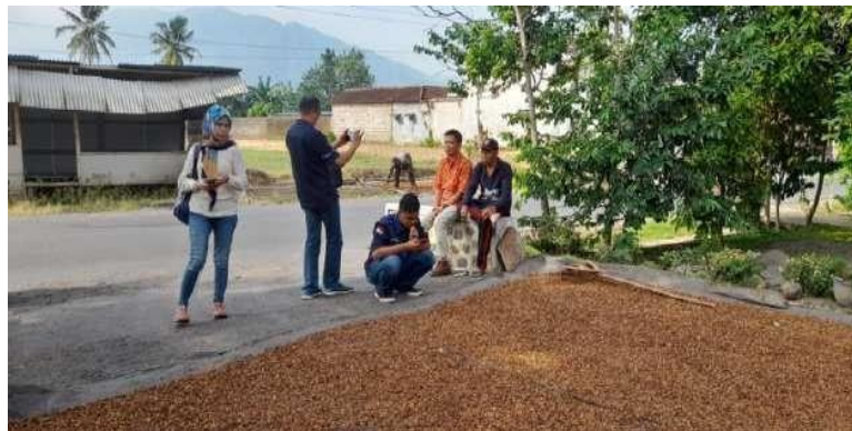
Gambar 3. Dokumentasi wawancara dengan masyarakat desa Lampeji

Lokasi penelitian yang dipilih yakni desa Lampeji Kecamatan Mumbulsari Kabupaten Jember. Desa ini dipilih karena memiliki angka stunting balita yang relatif tinggi utamanya di Kabupaten Jember. Selain itu, desa Lampeji memiliki kader penggerak posyandu yang secara efektif dan fokus dalam memberikan edukasi terkait stunting. Sasaran edukasi yakni kepada para ibu yang ada di desa tersebut. Setelah disepakati letak pengabdian dan tema yang diambil, tim terjun ke lapangan untuk melakukan observasi awal. Observasi awal dilaksanakan pada bulan April dan Mei 2023. Observasi ini dilakukan guna memahami kompleksitas dan dinamika masalah stunting yang terjadi di Desa Lampeji, Kecamatan Mumbulsari, Kabupaten Jember. Kegiatan observasi ini difokuskan guna memahami kondisi sosial masyarakat, kondisi stunting pada anak dan ingin mengetahui bagaimana pemahaman ibu terkait pemberian makanan yang bergizi cukup pada anak. Observasi dilakukan menggunakan dua pendekatan yakni pendekatan partisipatoris, serta wawancara (diskusi). Pemilihan metode tersebut didasarkan pada berbagai alasan kemudahan pelaksanaan proses pendampingan. Pada saat observasi awal, pihak mitra akan membuat persetujuan kerjasama kemitraan (MoU) dengan pelaksana kegiatan.