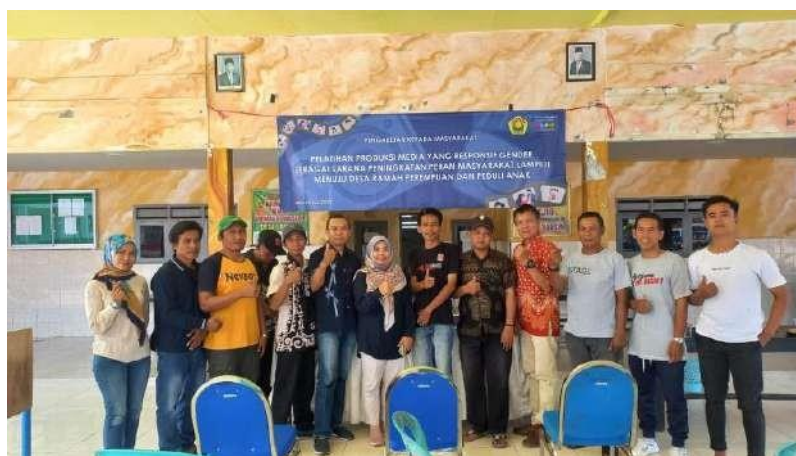
Gambar 7. Dokumentasi Tim Pengabdian Bersama Mitra

Tim mendampingi masyarakat desa Lampeji dalam merealisasikan program pembuatan media video edukasi. Tahapan pembuatan media dimulai dari penentuan judul video, penentuan pemeran dan aktor, penulisan naskah dan pengambilan gambar serta proses editing video.