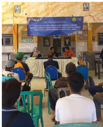
Gambar 5. Peyusunan Pendampingan Tim Pengabdian Bersama Mitra (Kepala Desa Lampeji)

Sosialisasi dilakukan di balai Desa Lampeji Kecamatan Mumbulsari Kabupaten Jember pada bulan Mei. Sosialisasi dimaksudkan agar mitra (dalam hal ini pemerintah desa Lampeji) mendapatkan pemahaman yang diinginkan oleh tim pengabdian. Tujuan dari sosialisasi ini adalah mampu secara komprehensif menyampaikan rencana secara keseluruhan. Tema yang diusung yakni Stunting dan Media, sementara fokus kegiatan diarahkan pada bagaimana media berperan dalam pemberian edukasi stunting. Pelaksanaan pengabdian pada bulan Mei 2023 dan goals yang ingin dicapai adalah memberikan edukasi bagi masyarakat khususnya ibu terkait pemberian makanan yang sehat dan bergizi bagi ibu dan anak dalam upaya penurunan stunting.