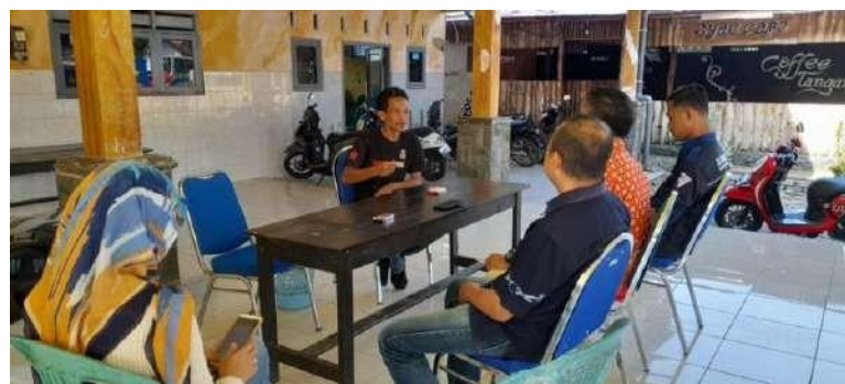
Gambar 4. Wawancara dan diskusi dengan Kepala Desa Lampeji

Observasi di lapangan memberikan tim gambaran menyoal bagaimana kondisi stunting pada anak desa Lampeji. Beberapa masyarakat yang berkesempatan di wawancarai juga membenarkan bahwa desa Lampeji sejumlah anak mengidap stunting baik yang tampak maupun yang tidak tampak ciri fisiknya. Data hasil observasi awal, kemudian diklasifikasi dan dirumuskan sehingga ditemukan berbagai masalah, kendala dan kekurangan yang dihadapi oleh masyarakat khususnya menyoal stunting. Permasalahan stunting dimulai dari tingginya angka pernikahan dini, tingginya angka perceraian, minimnya pengetahuan ibu terkait gizi pada anak, kualitas ekonomi yang rendah sehingga ketidakmampuan keluarga dalam memberikan makanan yang sehat dan bergizi cukup bagi ibu hamil dan balita. Permasalahan-permasalahan tersebut kemudian dipetakan dan dibuat berbagai rumusan masalah yang sistematis sehingga mempermudah dalam perancangan kegiatan pendampingan serta penyusunan solusi pemecahannya.