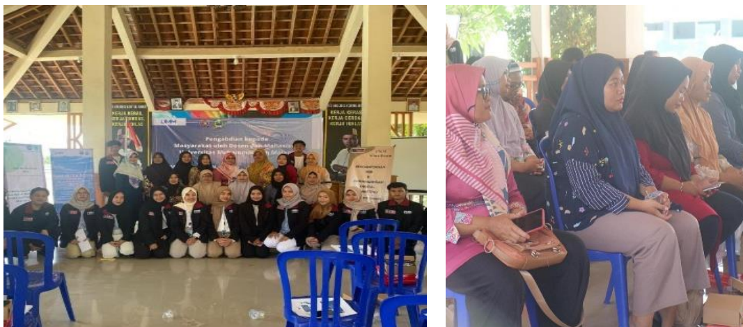
Gambar 3. Dokumentasi Kegiatan Sosialisasi

Kegiatan sosialisasi ini direncanakan melibatkan aparat pemerintah desa, anggota pengelola BUMDes, Badan Permusyawaratan Desa (BPD), perwakilan aparat pemerintah kabupaten Malang, dan perwakilan Masyarakat desa Soco. Dengan melibatkan berbagai pihak terkait, diharapkan informasi mengenai prinsip pengembangan BUMDes dapat tersebar secara luas dan pemahaman bersama dapat terbentuk. Pentingnya materi digital marketing diangkat sebagai bagian dari sosialisasi untuk membekali pihak terlibat dengan pengetahuan dan keterampilan dalam memanfaatkan platform digital untuk meningkatkan promosi dan pemasaran wisata Sohedden (Wibowo, 2024).