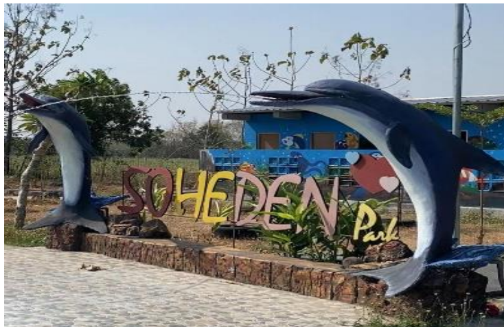
Gambar 2. BUMDes Wisata Edukasi Soheden

Pada tahap awal perencanaan program kerja, tim pengabdian mengambil inisiatif untuk melakukan survei awal tentang pengelolaan Wisata Edukasi Soheden. Langkah ini dianggap sebagai bagian integral dari upaya pengembangan Badan Usaha Milik Desa (BUMDes). Untuk mencapai tujuan tersebut, diluncurkan sebuah program penelitian yang berfokus utama pada peran perangkat desa, pengelola BUMDes, dan perwakilan Masyarakat.