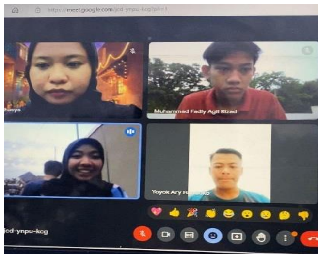
Gambar 4. Kegiatan Evaluasi Daring

Tim pengabdian yang terdiri dari dosen dan mahasiswa PMM mitra dosen secara strategis melibatkan lokasi dan destinasi menarik di Soheden Desa Soco Magetan dalam setiap konten yang diproduksi. Tujuannya adalah agar masyarakat dapat dengan jelas menyaksikan keindahan dan potensi wisata yang unik. Pembuatan konten ini tidak hanya untuk mempromosikan wisata Soheden, tetapi juga sebagai upaya untuk meningkatkan kesadaran luas mengenai keindahan dan potensi lokal yang dimiliki oleh Desa Soco. dengan menyertakan unsur edukatif dalam setiap kontennya, PMM berharap dapat merangsang minat dan apresiasi masyarakat terhadap keunikan dan kekayaan wisata Soheden. Melalui pendekatan ini, diharapkan dapat tercipta dampak positif yang berkelanjutan, memperluas daya tarik Soheden sebagai destinasi wisata yang diakui dan dicintai oleh masyarakat dari berbagai lapisan.