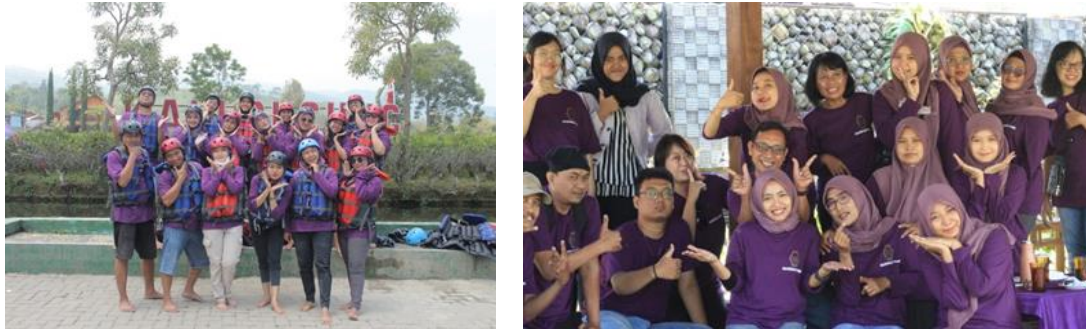
Gambar 2. Dokumentasi Kegiatan.