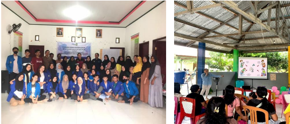
Gambar 3. Pemberian materi mengenai Perilaku Hidup Bersih dan Sehat

pengetahuan kurang dilihat dari hasil pengisian kuesioner menjawab salah pada pertanyaan melakukan aktivitas fisik dapat membantu kesehatan dan merokok didalam rumah tidak berbahaya.