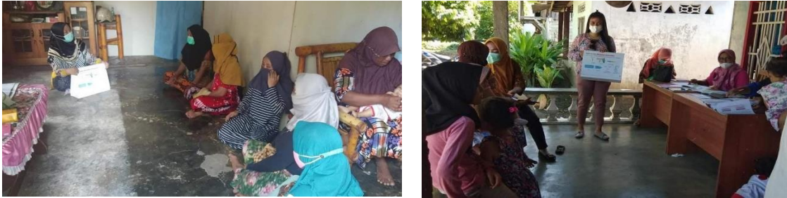
Gambar 2. Sosialisasi terkait pentingnya Hidup Bersih dan Sehat kepada Masyarakat dalam hal ini ibu rumah tangga

Kegiatan ini telah dilaksanakan selama 2 hari. Pelaksanaan kegiatan pengabdian masyarakat terkait pengetahuan ibu rumah tangga dengan perilaku hidup bersih dan sehat di Desa Baluase berjalan sesuai harapan. Dalam kegiatan ini ibu-ibu rumah tangga bersedia hadir berperan aktif dalam pelaksanaan kegiatan. Proses kegiatan dapat dilihat pada gambar-gambar berikut: